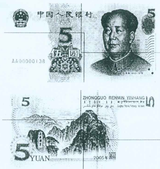
图B.5 伍圆检测采样点