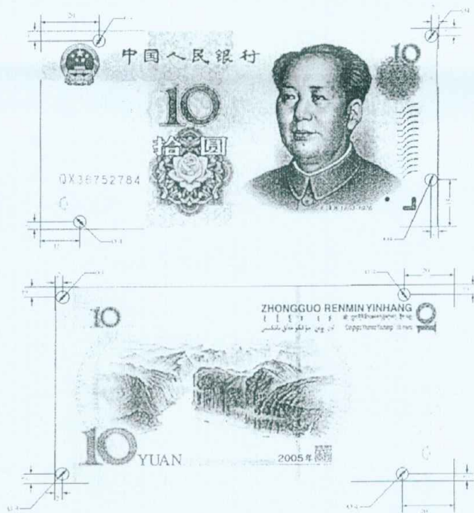
图A.4 拾圆检测采样点 (单位: mm)