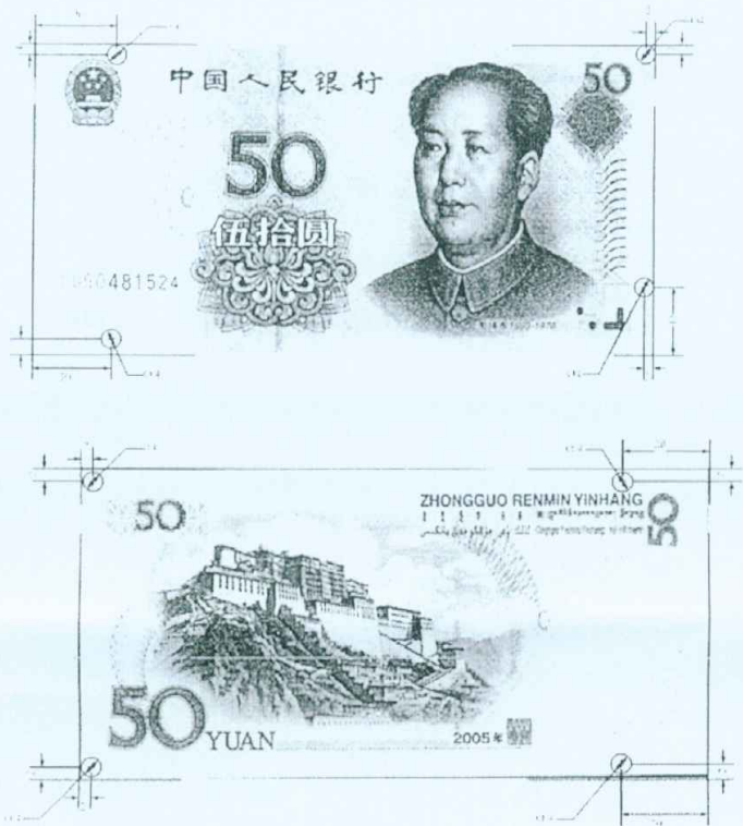
图A.2 伍拾圆检测采样点 (单位: mm)