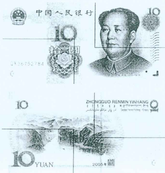
图B.4 拾圆检测采样点