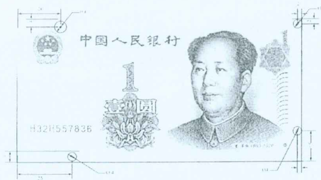
图A.6 壹圆检测采样点 (单位: mm)