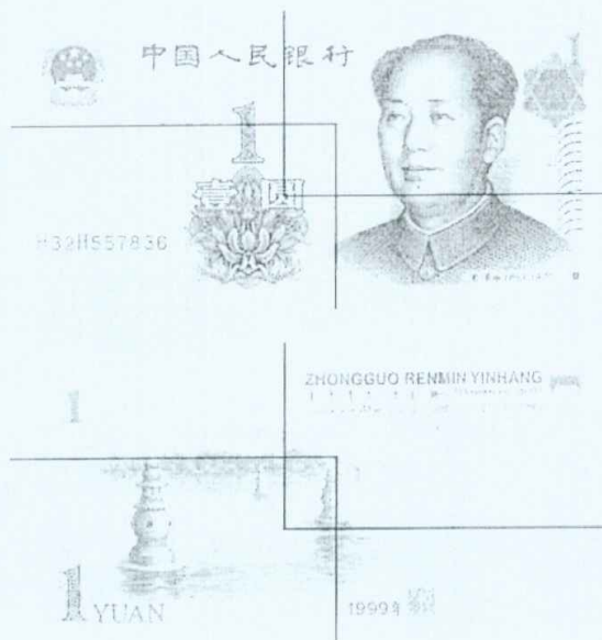
图B.6 壹圆检测采样点