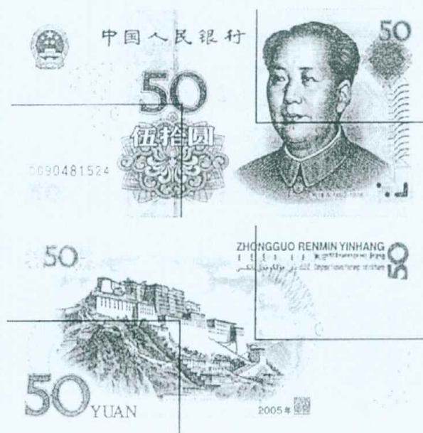
图B.2 伍拾圆检测采样点