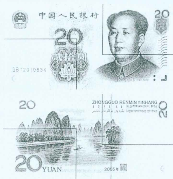
图B.3 贰拾圆检测采样点