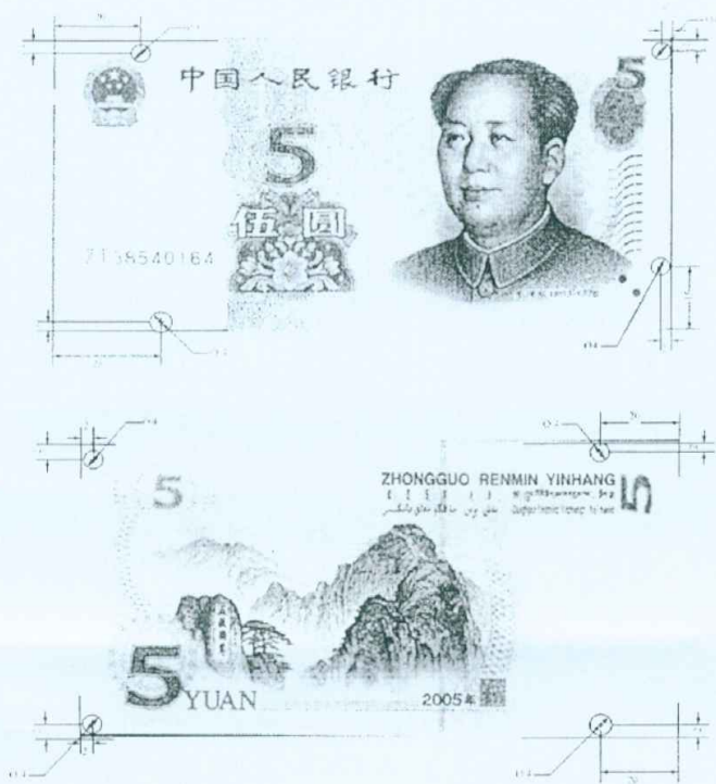
图A.5 伍圆检测采样点 (单位: mm)