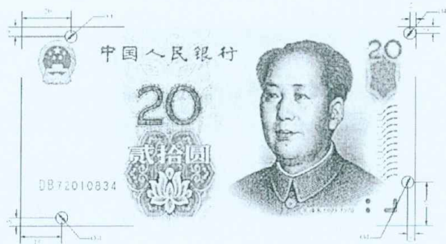
图A.3 贰拾圆检测采样点 (单位: mm)