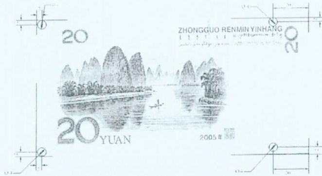
图 A.3 (续)