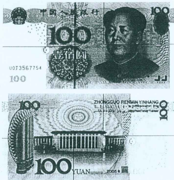
图B.1 壹佰圆检测采样点